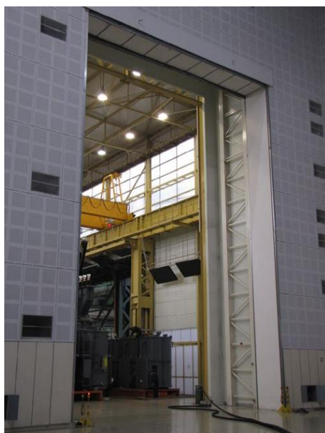
Siemens – Zagreb

Dimensions supérieurs sur avis technique jusqu'à 25 m x 25 m.