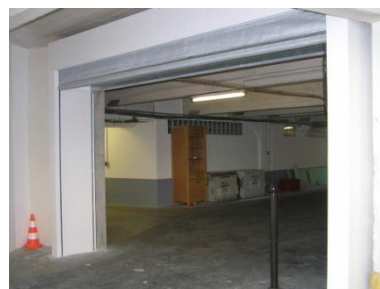
Parking rue de la Cavalerie - Paris 15è

En applique avec recouvrement. Pose en tunnel sur avis technique.