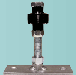
GUIDEP : Guide de porte à Olive à visser

PORTE COUPE - FEU NE METTEZ PAS D'OBSTACLES A LA FERMETURE