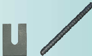
RECAL12/20 ou 30 : Cale fourchette EZ ou Galva 40x55x12/10ième 40x55x20/10ième 40x55x30/10ième