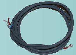
RECA1PA : Câble SYT 1 paire 9/10ième